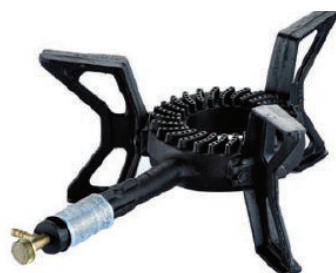
(Abb. ohne ZS)