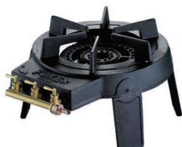
(Abb. ohne ZS)