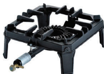
(Abb. ohne ZS)